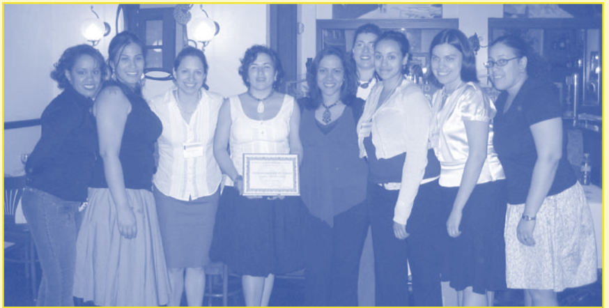
LORE members receiving the Latinas in Action Award, Washington, D.C., May 2006

Coordinadora de Movilización Comunitaria 2003-2006