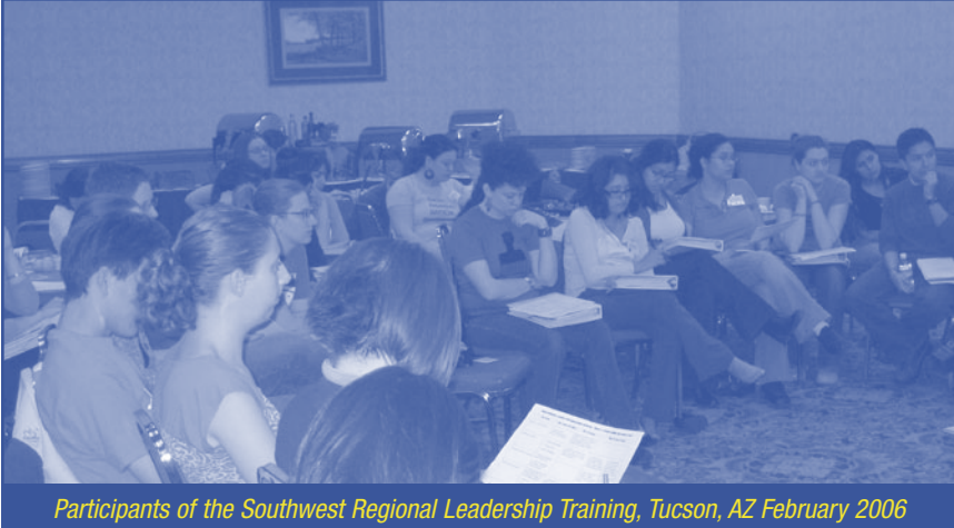
Participants of the Southwest Regional Leadership Training, Tucson, AZ February 2006

By Alexandra DelValle • Former Community Mobilization Coordinator