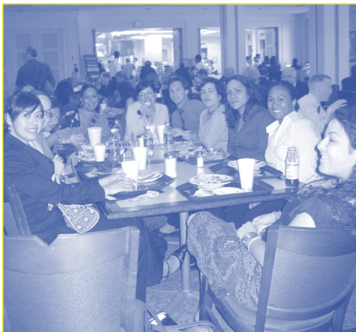
Participants at the National Advocacy Weekend, May 2006. Washington, D.C.

Para mayor información sobre COLOR, llame al 303-393-0382, o escriba a info@colorlatina.org .