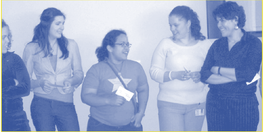
Philadelphia LOLA Graduates, April, 2006