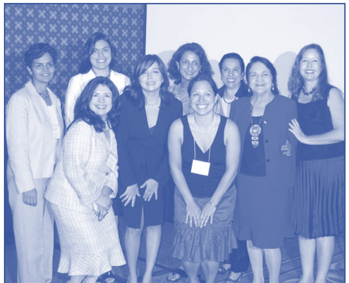
Speakers at the event “Promoting the Reproductive Health of Latina Immigrants.” July, 2006 Los Angeles, CA. This event was sponsored by: NLIRH, California Latinas for Reproductive Justice, Ipas and the National Health Law Program.

For more information on COLOR, call 303-393-0382 or e-mail: info@colorlatina.org . ●