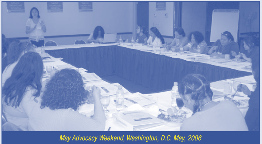
May Advocacy Weekend, Washington, D.C. May, 2006